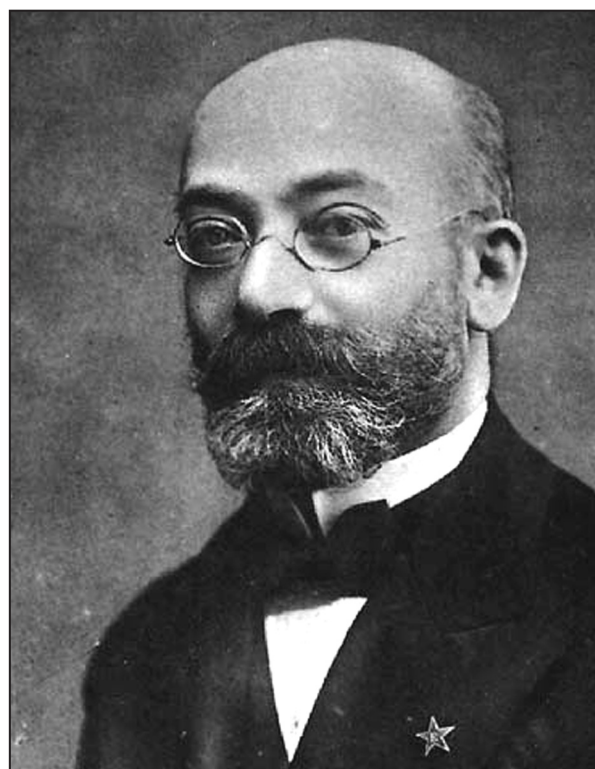
■ Ludwik Zamenhof från Polen presenterade esperanton år 1887.

Många radiostationer som kan höras via Internet har även sändningar på esperanto. LIBE:s medlemmar värderar høgt de nationella organisationer som under åren har stött sina medlemmar till att hitta en väg till internationalitet via esperanton, till exempel genom esperanto-kongresserna. Som medlem i EBU har LIBE en plats i EBU:s kommission för utbildning och kultur.