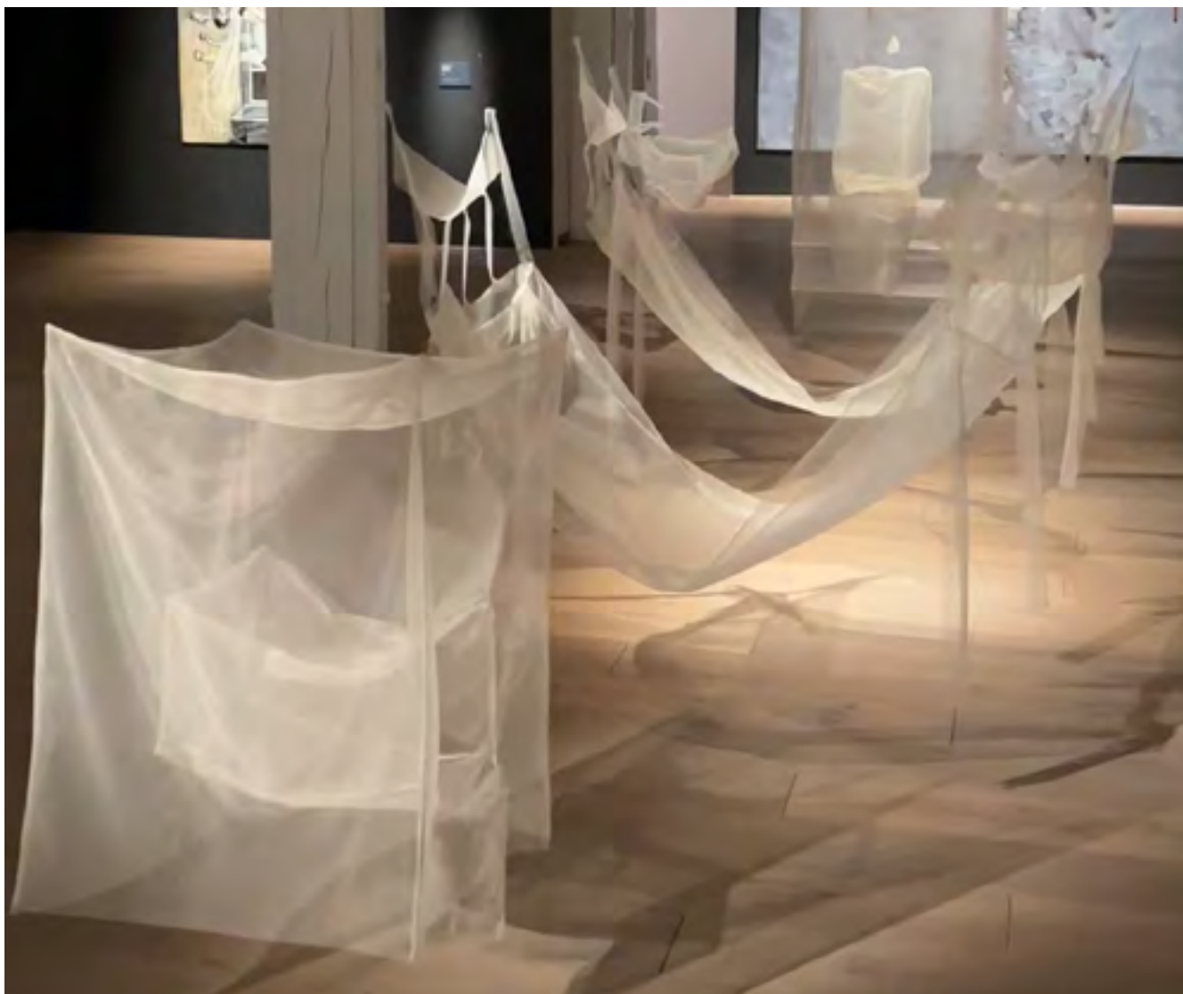
■ Tvättställ eller vagga? Den slutliga syntolkningen sker i lyssnarens sinne.