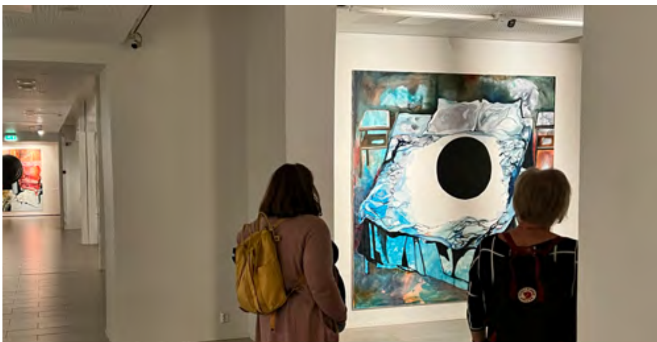
■ Pricken eller sängen? Vad är viktigare? Vilkendera ska man beskriva först?