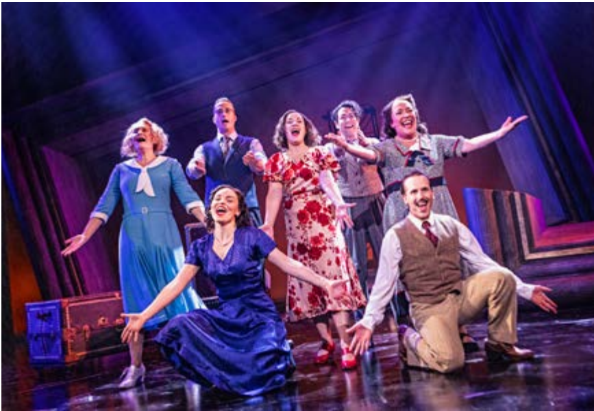
Syntolkas. Wasa Teaters musikal "Vänd om min längtan" syntolkas fredagen den 27 oktober.

Du hittar även info om oss på http://www.fss.fi/sv/distriktsforeningar/vasa samt på vår facebookside: https://www.facebook.com/vasasynskadade . Med jämna mellanrum finns även info i Torgplatsen i Vasabladet samt i Föreningsspalten både i Vbl och Sydin.