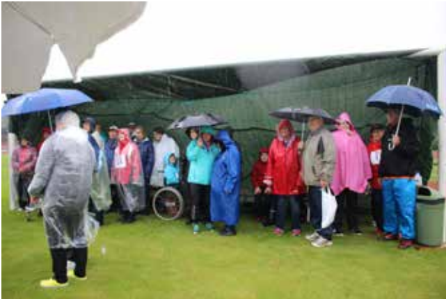
▲ SKYDD. I väntan på sin tur stod slungbollskastarna under en tillfälligt uppspänd presenning.