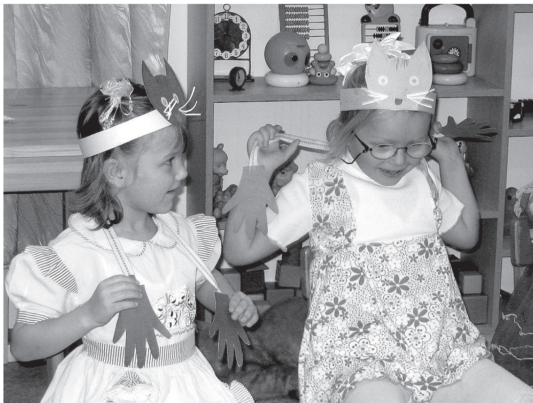
Förskolelever vid skolan för synskadade i Karelska republiken.