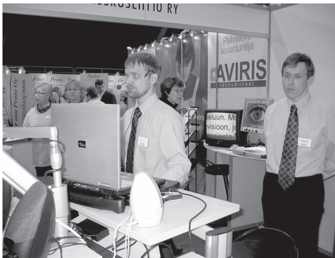
Centralförbundets mäsständer fick besök av västnylänningar.

Synskadades Centralförbund var den första utställaren som fick besök av oss. Personligen har jag alltid varit intresserad av teknik och i dagens värld är utbudet av tekniska hjälpmedel rätt så omfattande. Det som just nu är aktuellt är väl mobiltelefon med