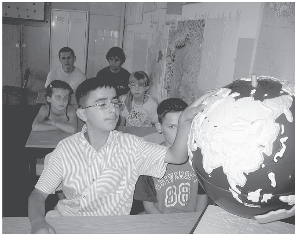
Skolan i Peja är relativt välförsedd. Här är geografi på gång.

ring av eleverna till det allmänna skolsystemet, det vill säga för specialskolor eller för resurscentra. Svaret var givet.