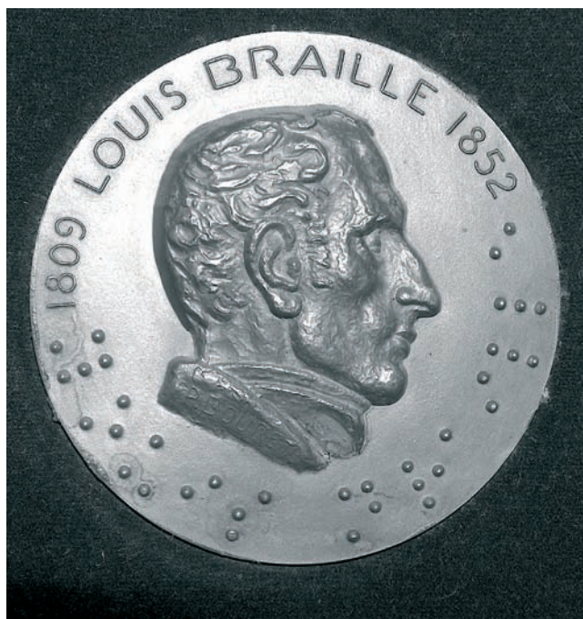
En kopparmedalj med Louis Brailles porträtt hänger i FSS konferensrum.

(SC) FSS Braille-projekt som startade 2003 har fått en uppföljning. I Penningautomatföreningen RAY:s understödsförslag har FSS sammanlagt tilldelats 473 000 euro för 2006. Braille II-projektet för utvecklandet av punktskriftskunnandet bland vuxna synskadade 2006–2008 har för sitt första år reserverats 50 000 euro.