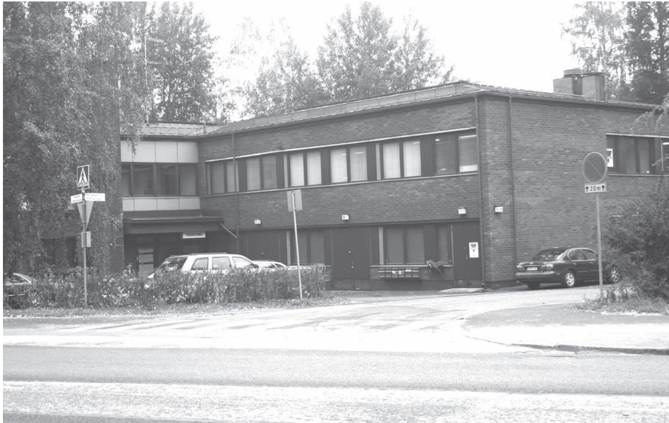
Huset vid Petasvägen 4 i Helsingfors inhyser idag bl.a. fyra möbeltapetserare och en antikfirma.

Han motiverar också varför den skriftliga ansökningen är så viktigt med att understöden inte får bero på personligheter utan alla ska bli lika behandlade, samt att en ansökan som någon skrivit under med sitt namn står den personen för – muntligen kan man lättare få en något felaktig bild. Ansökningstiden är löpande och blanketten samt