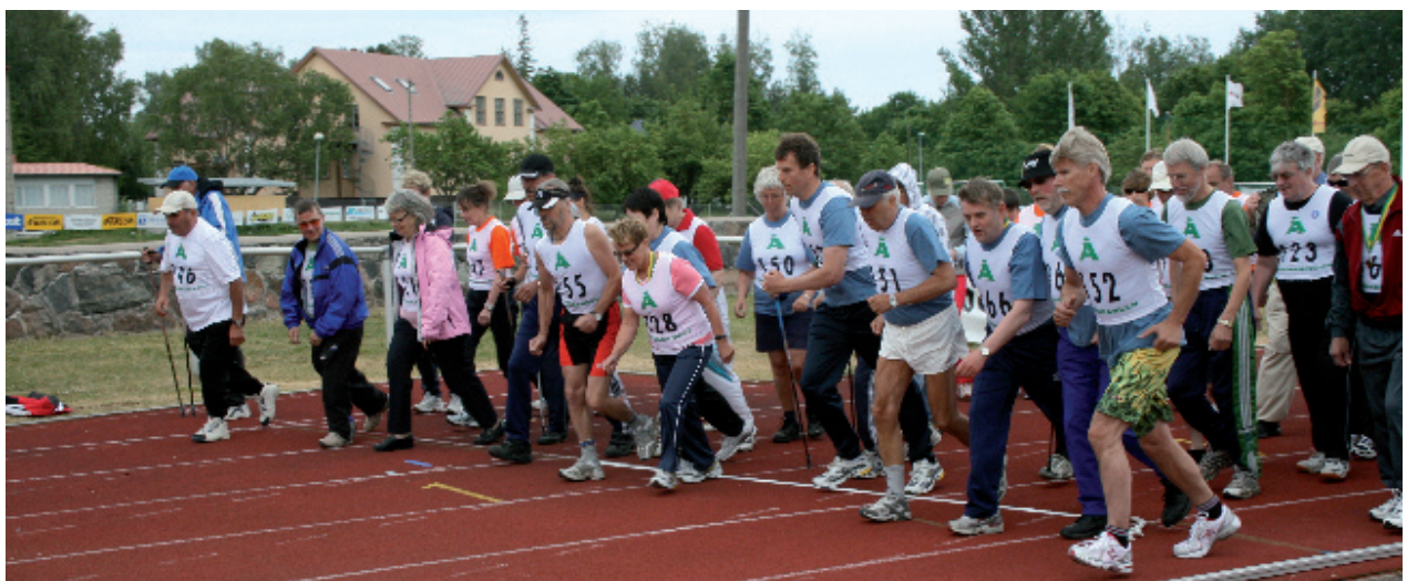
Startskottet går för gångtävlingen med många deltagare.