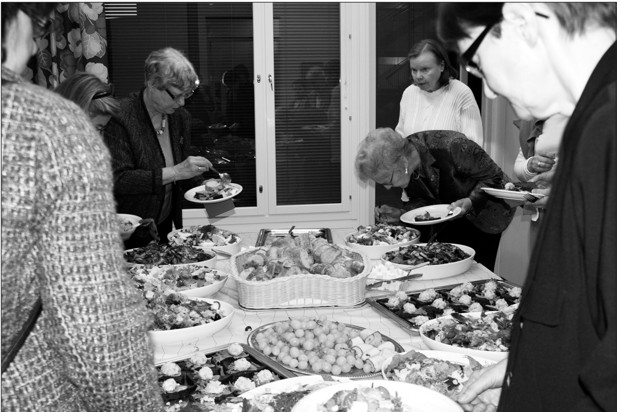
■ Mat och dryck i fransk stil låter sig väl smaka.