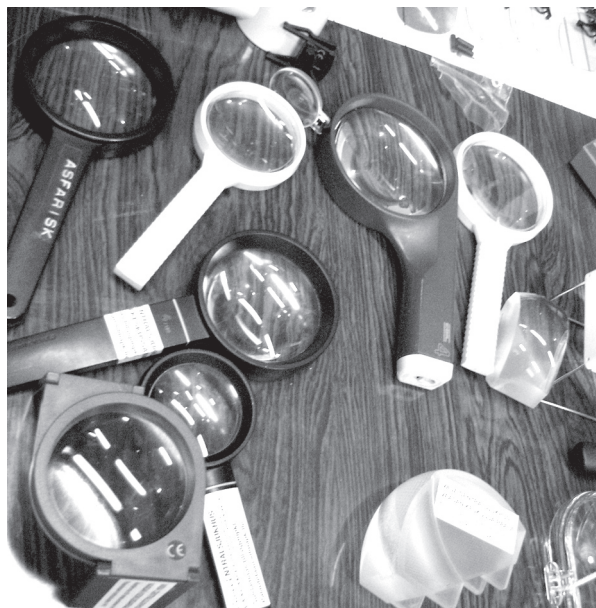
■ Många olika hjälpmedel förevisades.

Då temadagen i Oravais avslutades på eftermiddagen var många tankar väckta hos deltagarna.