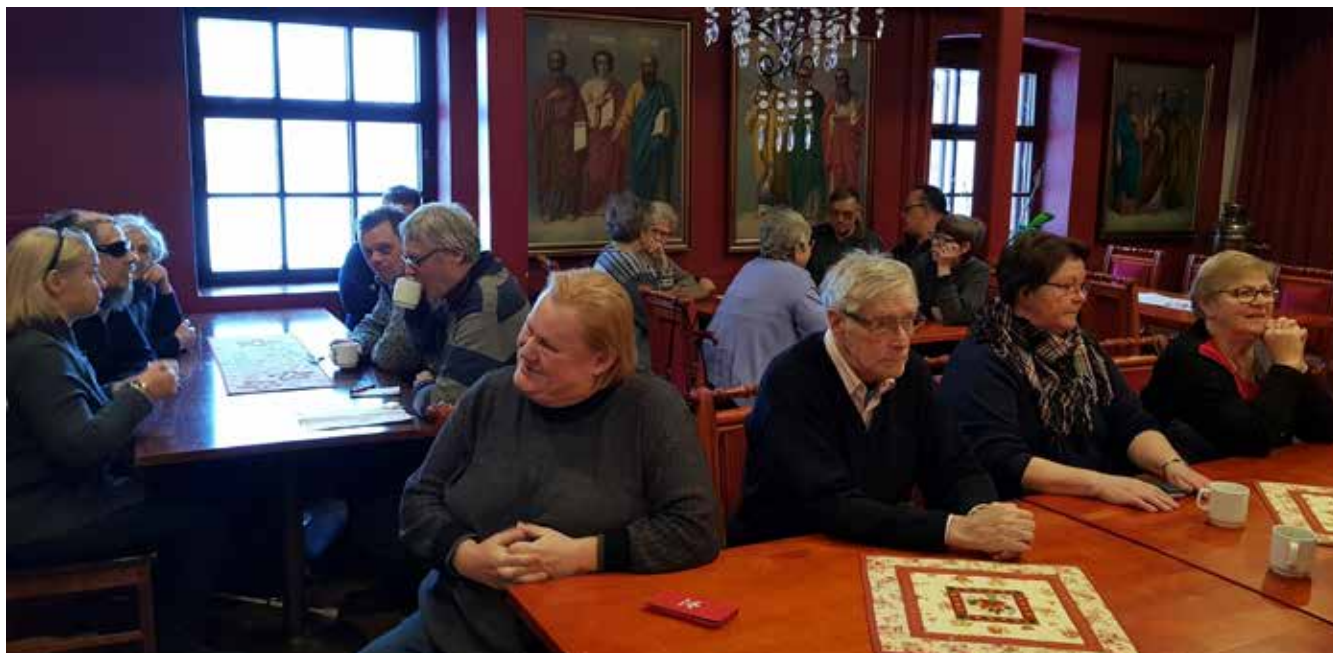
▲ Nya Valamos huvudkyrka är byggd år 1977. På bilden ovan tar besökargruppen tar igen sig med kaffepaus.

Och gruppen får veta att det är gudstjänst flere gånger under dygnet och att de har många olika arbetsuppgifter. Han förevisade sin dräkt, en fotsid svart dräkt och en svart huvudbonad. Ett annat arbete är tillverkningen av bivaxljus. I kyrkan brinner det många ljus hela dagen och besökarna kan köpa och tända ljus vid någon av de många pulpeterna i kyrkan.