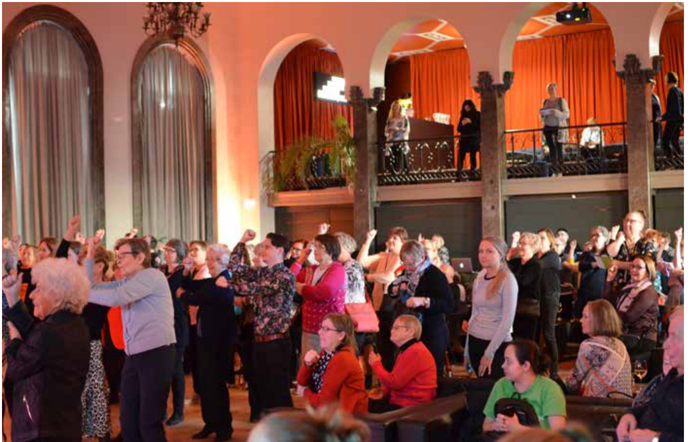
▲ DANS. På det här discot kunde alla dansa och vara med oberoende av funktionsnedsättning.