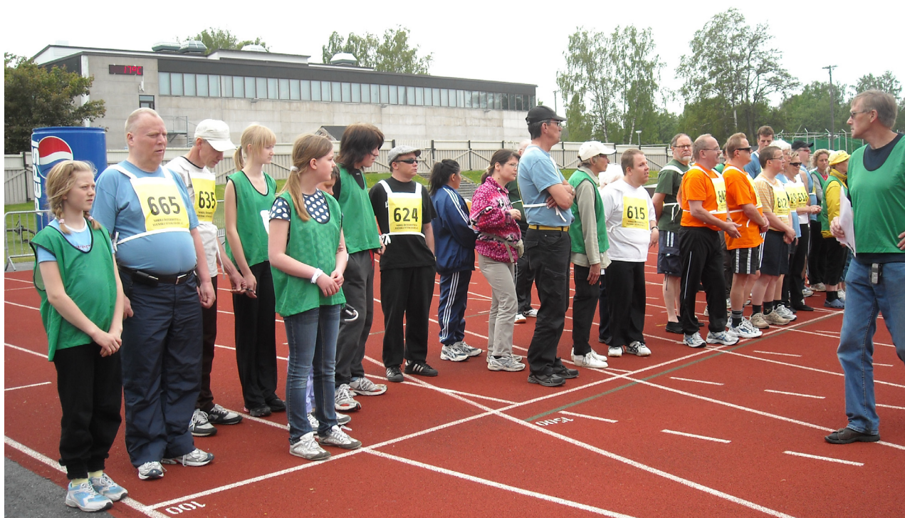
■ En del av deltagarna samlade vid startlinjen.