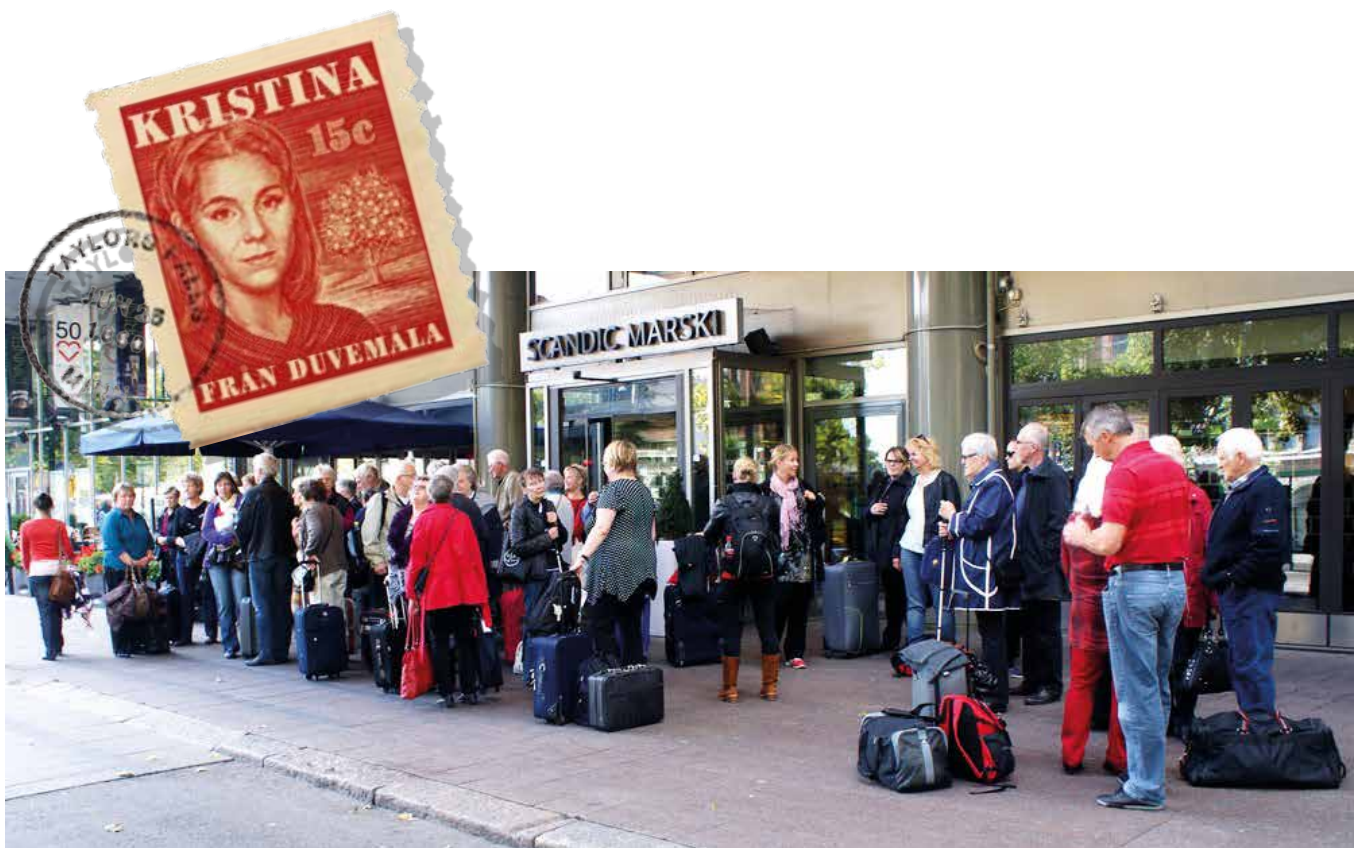
▲ Hela gänget samlat utanför hotellet i huvudstaden.