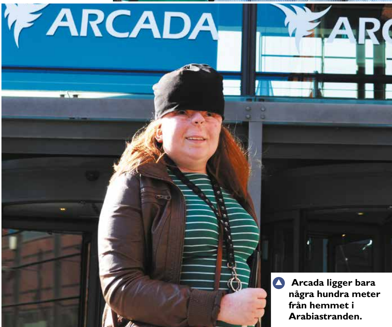
▲ Arcada ligger bara några hundra meter från hemmet i Arabiastranden.